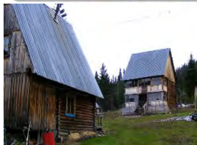
Приют «Кузбасский» (вдали)

Расположен на правом берегу реки Томи, в 1,5 км от станции Лужба. Состоит из семи двухэтажных домов, каждый из которых рассчитан на 20 человек. Во всех домах имеется электричество, в комплексе работает баня. Устойчиво работает мобильная связь «Мегафон», «Билайн».