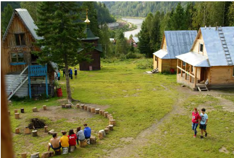
Справа – туристские приюты Евстигнеевский и Потемкинский. Вдали, за часовней видна река Томь.