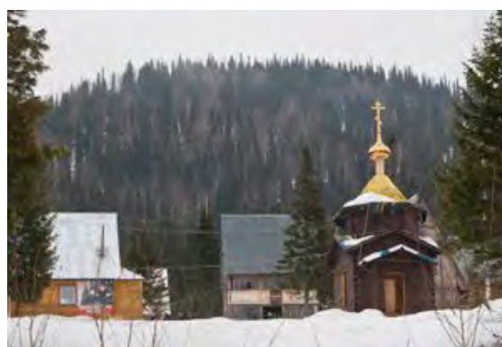
Приюты «Кузбасский» (за часовней) и «Потемкинский» (слева)