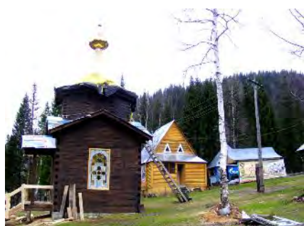
Приют «Потемкинский», слева - часовня