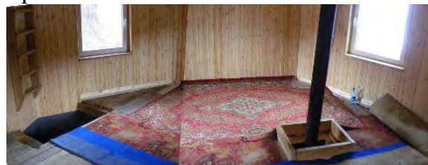
Второй этаж туристского приюта

В районе возможно создание стационарных и передвижных палаточных лагерей. Здесь работают квалифицированные инструкторы филиала ГАУДО КОЦДЮТЭ, которые всегда готовы помочь туристским группам в решении любых возникших вопросов.