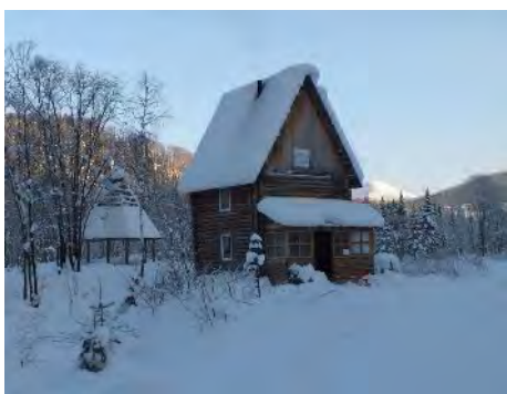
Приют «Саковский» зимой

Расположен в 1 км от поселка Амзас на левом берегу одноименной реки на насыпи стоявшего здесь несколько десятков лет моста.