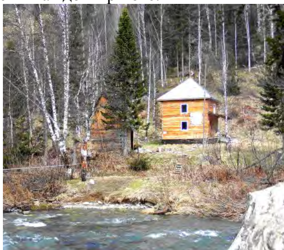
Приют «Кармановский». Слева - «параллельные перила».