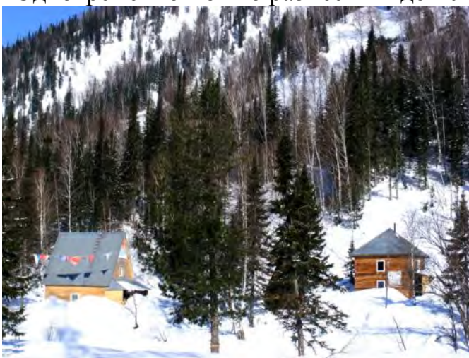
Приюты «Москвина» и «Кармановский» в марте.

Одновременно можно разместить до 20 человек в каждом приюте.